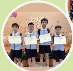
2024 Robofest機械人大賽金獎及多個獎項