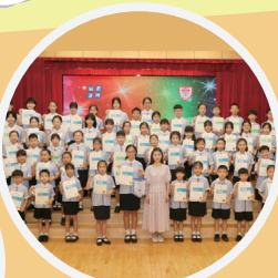
第75屆香港學校朗誦節中文及英文朗誦比賽冠軍及多個獎項