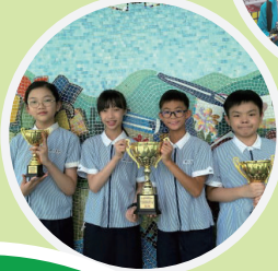
教育局STEM教育中心及藝術與科技中心舉辦「智慧儲能裝置挑戰賽」，榮獲 • 裝置效能比拼賽 優異獎 • 裝置外觀設計比賽 亞軍 • 太陽能供電燈飾設計比賽 冠軍