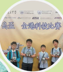
島盃 全港科技比賽