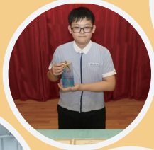
2023年全港少年托福大獎 (TOEFL Junior)