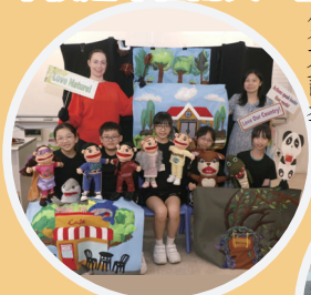
NET Section, Education Bureau— • Story to Stage Puppetry Competition 1st runner up • Outstanding performance award