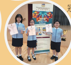
Language Kaleidoscope Challenge Champion